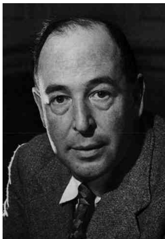
Clive Staples Lewis autor "Opowieści z Narnii"